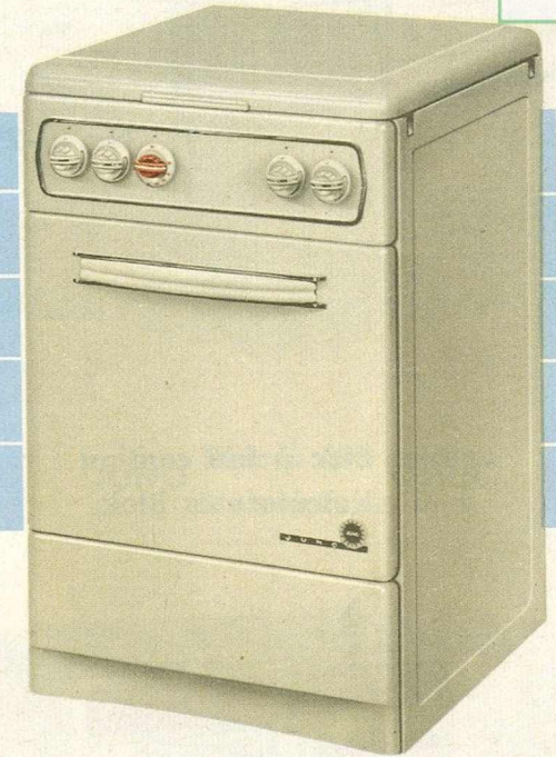
JUNO Cuisinière à Gaz No. 32-20-4 Gasfornuis

La maîtresse de maison pratique et réaliste verra sa tâche facilitée par l'emploi de cette cuisinière de dimensions normales. Les dernières nouveautés techniques alliées à l'élégance de ses lignes la feront mettre à la place d'honneur dans chaque cuisine.