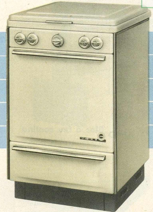
JUNO Cuisinière à Gaz No. 22-20-4 Gasfornuis

Modèle de grand luxe, cet appareil possède des qualités insoupçonnées et dès le premier coup d'oeil l'on s'aperçoit qu'il s'agit d'une cuisinière en avance sur son siècle.