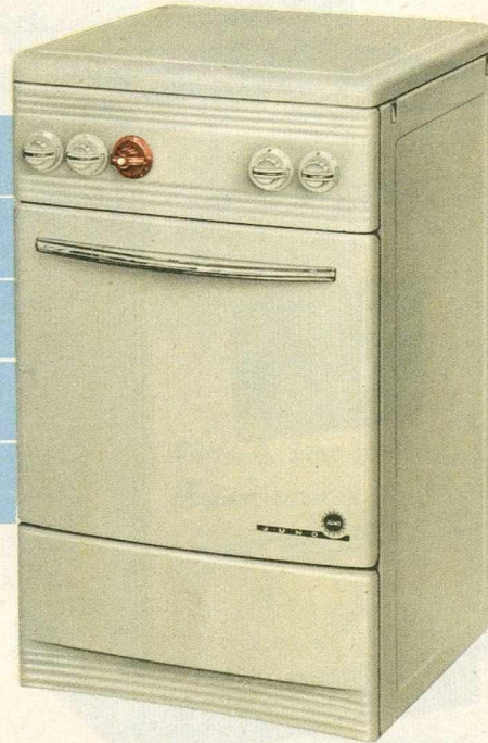
JUNO Cuisinière à Gaz No. 12-21-3 Gasfornuis

Emaillée ivoire sur 3 côtés et de présentation moderne, cette cuisinière de dimensions réduites qui lui permettent d'être placée dans n'importe quelle cuisine, possède un grand four répondant à toutes les exigences.