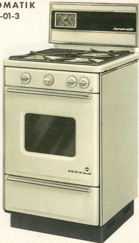
JUNOMATIK No. 22-01-3

JUNO Cuisinière à Gaz avec voyant et lumière Gasfornuis met venster en verlichting